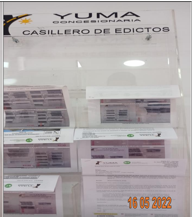
EDICTOS DE LA R_34182 YC-CRT-114339